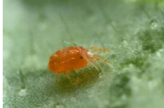
Dvalhona av Tetranychus urticae .

På hösten går befruktade honor av växthus-spinnkvalstret till vintervila efter att först ha ändrat färg och blivit röd-orange så kallade dvalhonor. Detta styrs mest av dagslängd, men temperatur och tillgång på föda spelar in, så man kan inte ange datum med någon noggrannhet. Dvalhonorna gömmer sig på alla upptänkliga ställen där de hittar skrymslen i växthuset – både på marknivå och i övre konstruktioner.