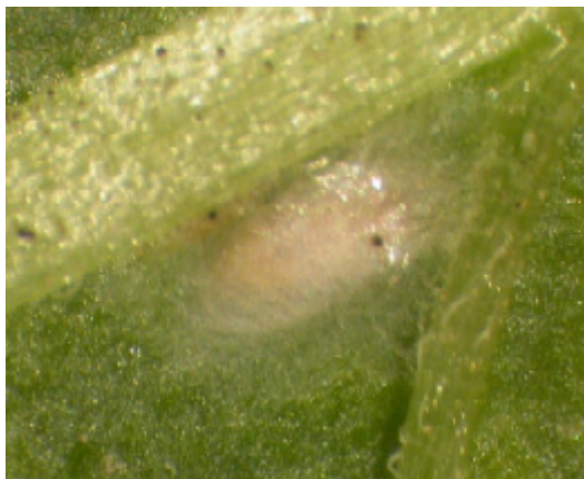
Kokong med puppa av Feltiella tetranychi .

Myggan lägger ägg i spinnkolonier, larverna äter och förpuppas sedan i kokonger som de spinner, vanligtvis intill en bladnerv.