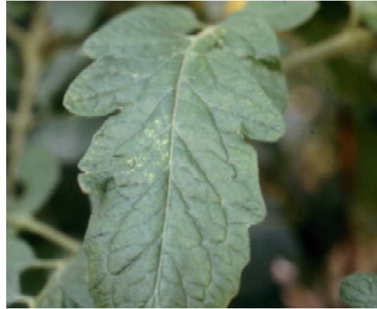
Symptom av växthuspinnkvalstret i tomat.

Brakar spinnangreppen komma tidigt i odlingen kan man som förebyggande åtgärd placera ut små mängder Phytoseiulus under några veckor på de ställen där angreppen först brukar synas.