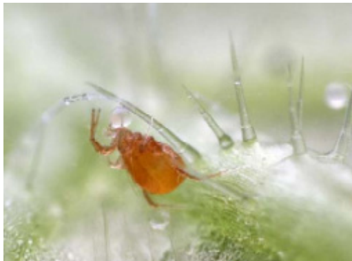
Rovkvalstret äter spinnägg.

Även om rovkvalster inte kan flyga så är de rätt rörliga och mycket duktiga på att finna byte. De tar ”doftspår” från bytesdjuren till hjälp. Alla stadier av spinnkvalster konsumeras, även av rovkvalsternymforna (larverna äter inget), som kan ge sig på dubbelt så stora byten. De vuxna kan äta 20-30 spinnkvalsterägg per dag, eller 10-15 nymfer.