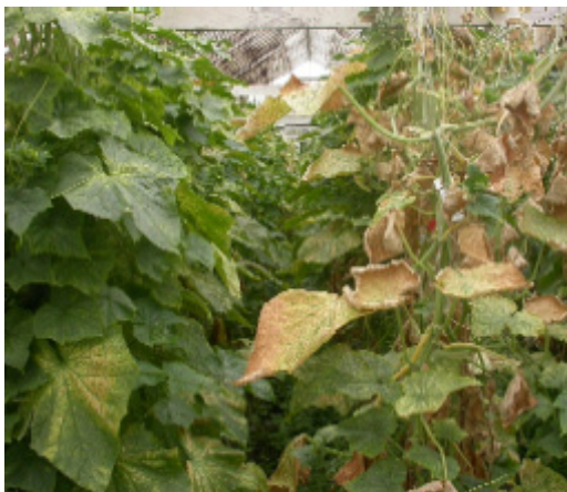
Kraftigt angrepp av växthusspinnkvalstret i gurka.

I växthusgrönsaker och vissa prydnadsväxter blir det ofta problem med Tetranychus urticae , växthusspinnkvalstret. Liksom de flesta andra arter i familjen Tetranychidae producerar T. urticae spinnväv som skydd för äggen i kolonierna. Väven syns tydligt om angreppet inte hejdas.