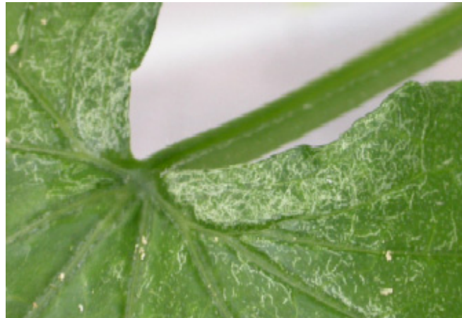
Symptom av Bryobia sp. i gurka.

Om ett angrepp av Bryobia sp. uppkommer i gurka bör blad med symptom skäras bort. Punktbekämpa sedan med växtvårdsmedel.