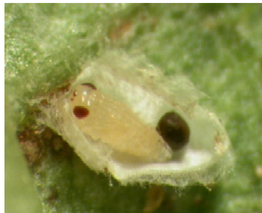
Öppnad kokong av Feltiella tetranychi visar parasitstekelpuppa.

Nyttodjuret utvecklas inte lika snabbt som Phytoseiulus , men har fördelen att de vuxna flyger omkring och söker upp nya spinnfläckar. Tyvärr drabbas larverna ofta av parasitering, så nyttan är högst variabel. Spinnkvalster angrips ofta också av olika svampar, särskilt på sensommaren när luften är som fuktigast.