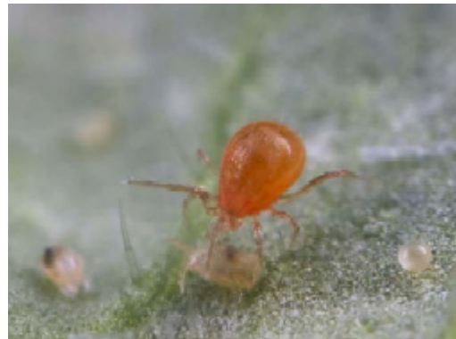
Rovkvalstret äter nymf av växthuspinnkvalstret.