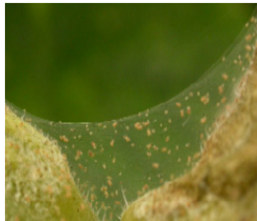
Spinnväv och kvalster på gurkblad.

Enstaka angrepp av T. cinnabarinus , ett cinnoberrött spinnkvalster som är nära släkt med T. urticae , kan förekomma i prydnadsväxter som hängpelargon. Fler arter som är vanliga i varmare länder ( T. evansi , T. ludeni , Eotetranychus lewisi m fl) riskerar vi få hit med importerat plantmaterial. På hallon och björnbär odlade i växthus kan dessutom frukträdsspinnkvalstret Panonychus ulmi uppträda.