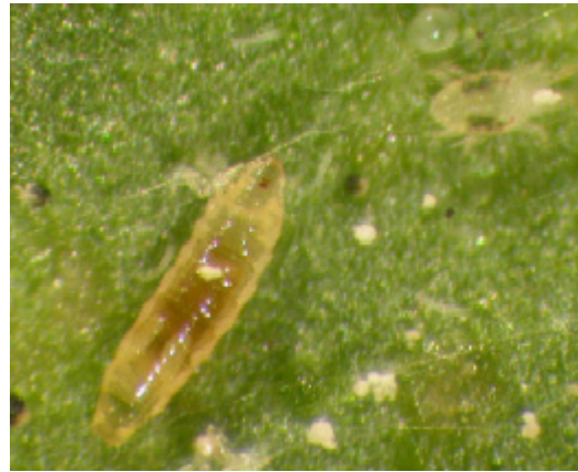
Larv av Feltiella tetranychi .

En rovlevande gallmygglarv är specialiserad på att äta spinnkvalster och deras ägg. Arten heter Feltiella tetranychi och finns i vår natur. Den tar sig ofta in i växthus sommartid.