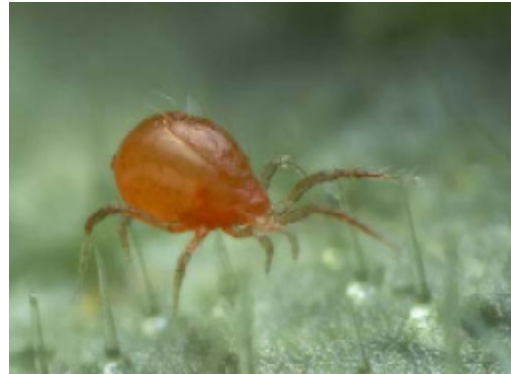
Hona av Phytoseiulus persimilis .

När spinnkvalster finns kommer äggläggningen igång, och förökningen av rovkvalster kan bli explosionsartad. Det är det enda nyttodjur vi använder som ibland gör slut på sin födokälla – det uppstår ingen balans.