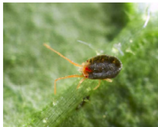
Bryobia sp.