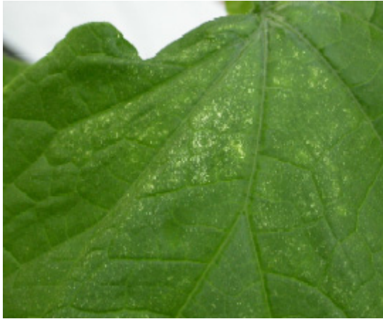
Symptom av växthuspinnkvalstret i gurka.

Bevaka plantorna väl. Helst ska hela personalen vara engagerad i att upptäcka tidiga symptom. Annars bör en särskild skadedjursspecialist utses som sköter all inspektion.