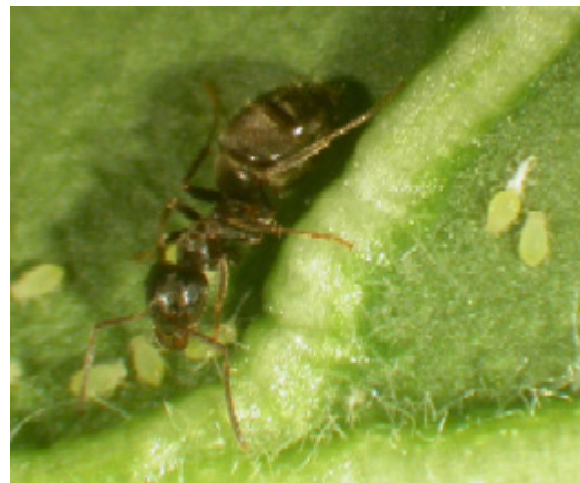
Myra i koloni av Aphis nasturtii .

Myror är mycket begivna på honungsdagg, hämtad direkt från lusens analöppning, och är aktiva försvarare av bladluskolonier. De kan alltså motverka biologisk bekämpning.