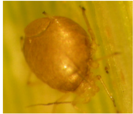
Havrebladlus med utgångshål av parasitstekel.

Den nykläckta stekeln gnager så ett cirkelrunt hål och kryper ut. Ibland faller den utskurna rundeln åter på plats, så mumien ser hel ut. Livscykeln tar knappt två veckor vid 20 °C, tio dagar vid 25 °C. Stekeln är aktiv ner till omkring 10 °C.