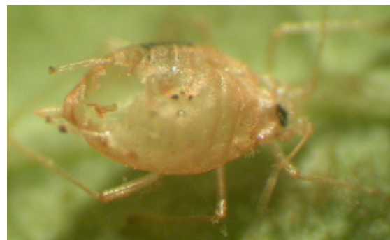
Trasigt utgångshål efter hyperparasit.