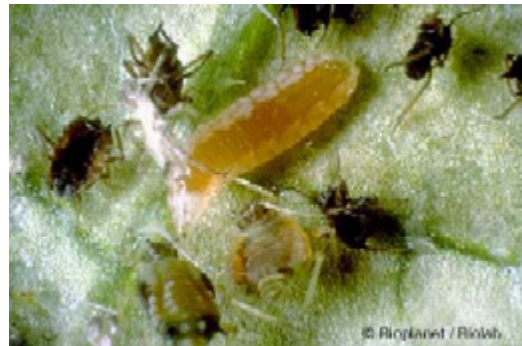
Larver av bladlusgallmyggan äter Aphis gossypii .

Rester av uppätta bladlöss ligger kvar som skrumpna, bruna skinn. (Hudrester som syns när bladlusnymfer ömsat skinn är däremot rent vita och mycket tunna.)