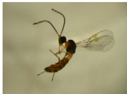
Aphidius colemani .

Denna parasitstekel angriper främst gurkbladlusen och persikbladlusen, men även andra småväxta arter som havrebladlusen.