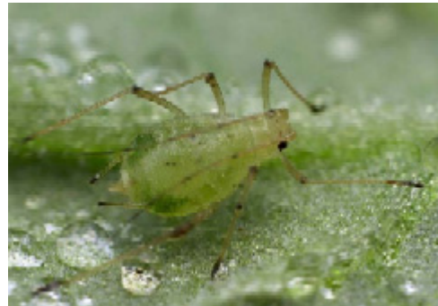
Aulacorthum solani .

Ibland ser man artnamnet Myzus nicotianae för de röda typerna, men enligt senare rön är detta en variant av M. persicae