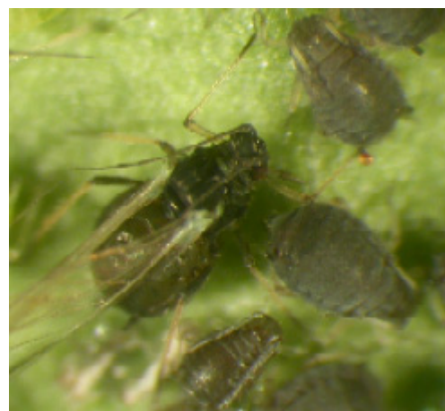
Aphis fabae .

På rötter av diverse växter går arter som Rhopalosiphum rufiabdominalis . (Observera att det man kallar rotlöss ofta är arter av ullsköldlöss, fam. Pseudococcidae.)