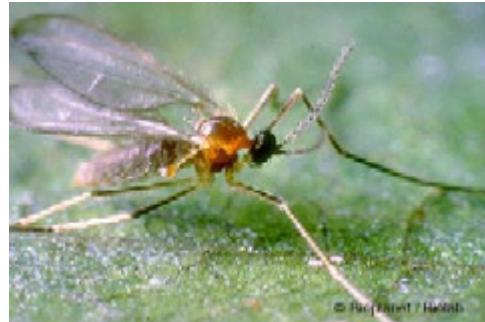
Bladlusgallmyggan Aphidoletes aphidimyza

Bladlusgallmyggan är ett bra komplement för uppröjning i bladlushärdar. Den är inte så snabb i förökningen, men larven är mycket rovgirig och dödar fler bladlöss än den äter. Alla slags bladlöss står på menyn.