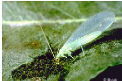
Guldögonsländan Chrysoperla carnea

Bladluslejon kallas sländans larver. De är rovgiriga nyttodjur som äter allehanda små insekter och kvalster.