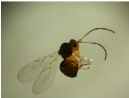
Alloxysta sp. (hyperparasit).

När en hyperparasit lämnat mumien syns det genom att utgångshålet har trasigt, ojämn kant.