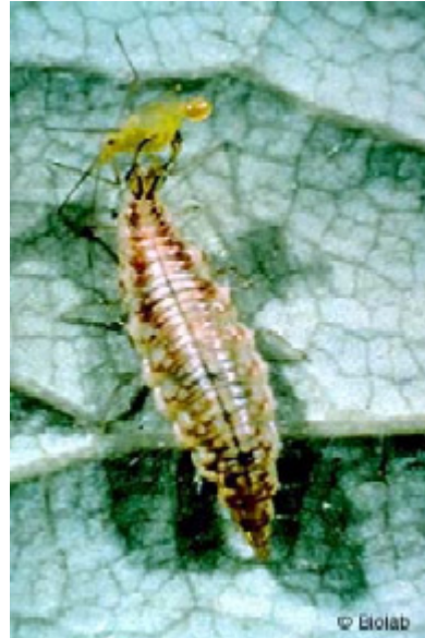
Bladluslejon – larv av Chrysoperla carnea .

Bladlöss har många andra naturliga fiender, som nyckelpigor och deras larver, blomflugelarver och rovlevande skinnbaggar. Inget av detta finns för närvarande kommersiellt tillgängligt i Sverige.